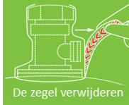
De zegel verwijderen

Zorg dat de hele bemanning geïnformeerd en ingelicht is over het veilig gebruik van gasflessen, gasinstallaties en de brandblussers. Benegas Light heeft een groene zegel op de kraan.